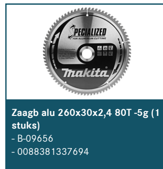
Zaagb alu 260x30x2,4 80T -5g (1 stuks)