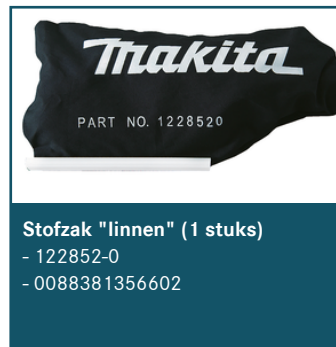
Stofzak "linnen" (1 stuks)