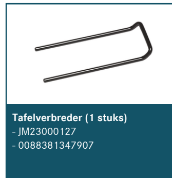
Tafelverbreder (1 stuks)