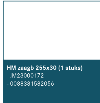
HM zaagb 255x30 (1 stuks)