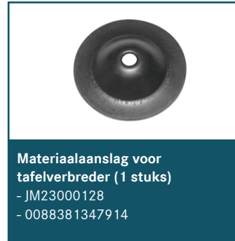
Materiaalaanslag voor tafelverbreder (1 stuks)