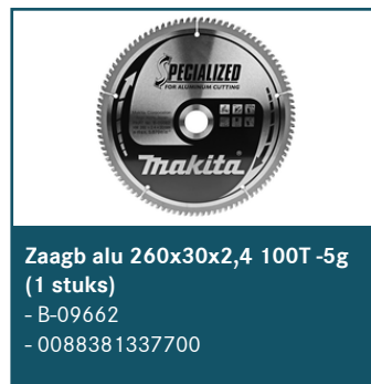
Zaagb alu 260x30x2,4 100T -5g (1 stuks)